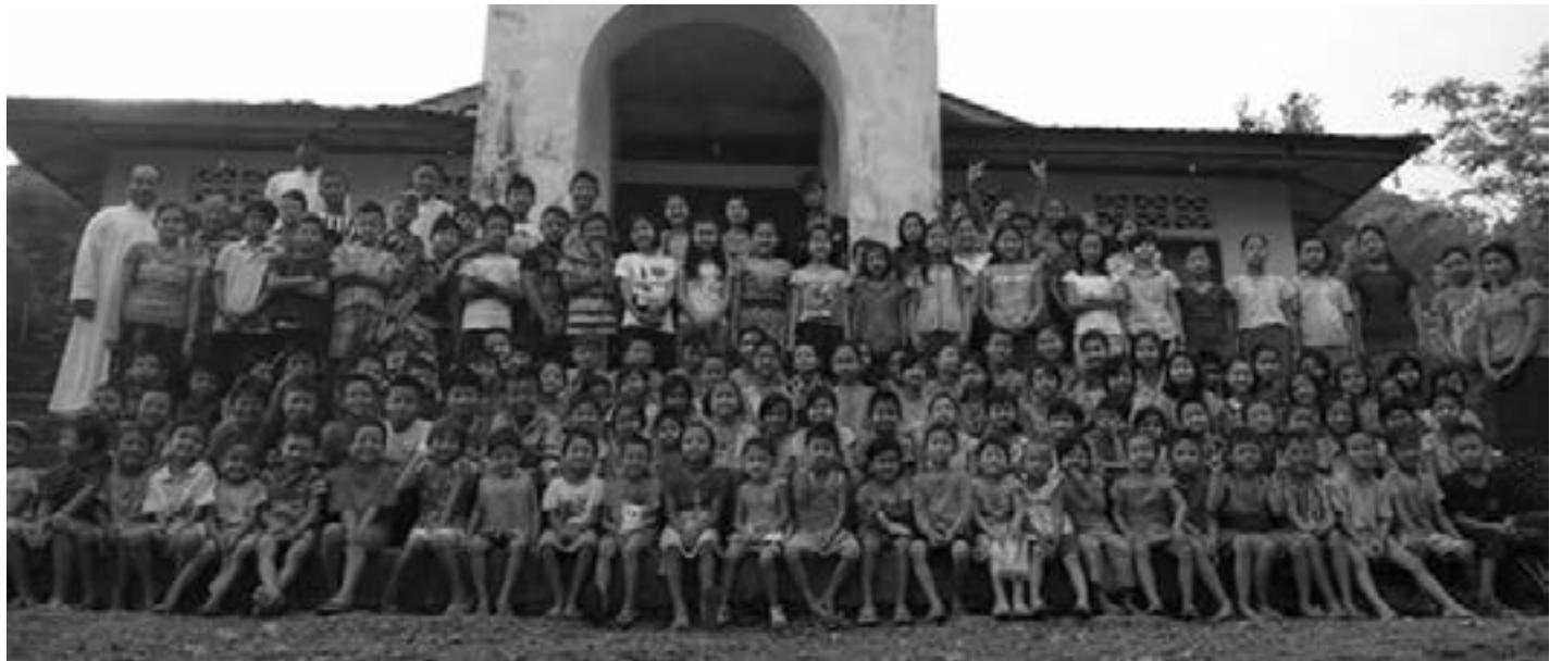
သီလရှင်(၄) ပါး၊ လုပ်အားပေးဆရာ/ဆရာမ များတို့က ဘာသာရေးဆိုင်ရာ ဗဟု သုတများ၊ ဓမ္မသီချင်းများ၊ ကစားခြင်း အမျိုး

ရဟန်းမင်းကြီးဆိုင်ရာ သာသနာပြု အသင်းများရုံး ဒါရိုက်တာသည် မော်လမြိုင် ဂိုဏ်းအုပ်သာသနာ မြိတ်တိုက်နယ် မဏေအရှေ့ ပျဉ်ချောင်းရွာရှိ ကလေးသူငယ်များထံသို့ သွားရောက်ကြည့်ရှုကာ သာသနာပြုကလေးသူငယ်များ အကြောင်း သိကောင်းစရာများ၊ သာသနာပြုများအနေဖြင့် အလေးထား လိုက်နာရမည့် ကိုယ်ကျင့်တရားဆိုင်ရာ ကျင့်စဉ်များနှင့် မိမိတို့၏ ခံစားချက်များကို နားလည်ခြင်းစသော အကြောင်းအရာများကို နှစ်ရက်တာ ပို့ချ ဝေမျှပေးခဲ့ပါသည်။