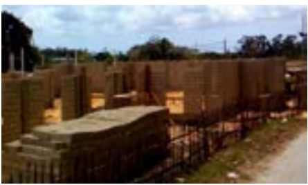
ကျူးဘားနိုင်ငံတွင် နှစ်ပေါင်း ၆၀ အတွင်း ပထမဦးဆုံး ဆောက်လုပ်ခွင့်ရသည့် ဘုရားကျောင်း ဆောက်လုပ်လျက်ရှိ စာမျက်နှာ ၆