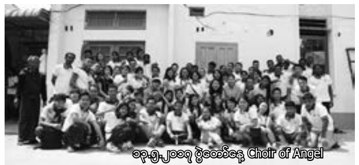
၁၃.၅.၂၀၁၇ ပွဲတော်နေ့ Choir of Angel