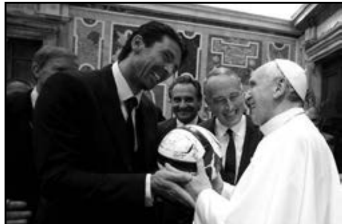
အိတလီနိုင်ငံနှင့် ဂျူဗင်တပ်စ် ဝိုင်းသမား ဘုရားဖူးက သူလက်မှတ်ထိုးထားသော ဘောလုံးကို ရဟန်းမင်းကြီးအား ဆက်သစဉ်