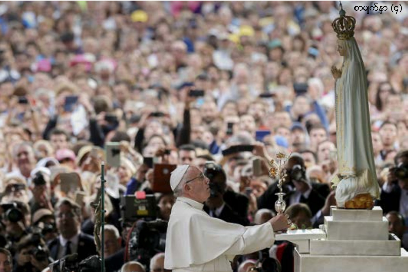
စာမျက်နှာ (၄)