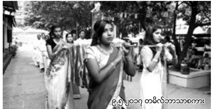
၉.၅.၂၀၁၇ တမိလ်ဘာသာစကား

ထို့နောက်တွင် ရက်အလိုက် က ယန်းဘာသာ၊ သာ သနာပြု ကလေးငယ် များနှင့် မိသားစုကော်မရှင်များမှ အင်္ဂလိပ် ဘာသာ၊ ချင်းဘာသာ၊ တမိလ်ဘာသာ၊ တရုတ်ဘာသာနှင့် ဖာတီမာ သာသနာ အ မျိုးသမီးအဖွဲ့မှ လက်တင်ဘာသာ၊ ကချင် ဘာသာ တို့ဖြင့် မစ္စားတရား ပူဇော်ခဲ့ကြ သည်။ နေ့စဉ်နိဗ္ဗိဒ်များ မစ္စားတွင် မယ်တော် စိတန်းလှည့်လည်ခြင်း၊ ရိုးရာပဒေသာ အက များဖြင့် ဘုန်းတော်ကြီးများအား ပင့်ဆောင် ခြင်းများပြုလုပ်ခဲ့ပါသည်။