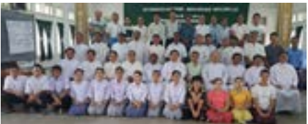
ဒုတိယအကြိမ်မြောက် ဘာသာပေါင်းစုံ နီးနှောဖလှယ်ခြင်း သင်တန်း စာမျက်နှာ ၉