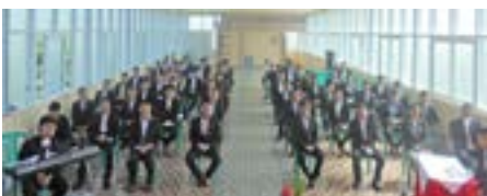
မြန်မာနိုင်ငံလုံးဆိုင်ရာ ကက်သလစ် ရဟန်းဖြစ်တက္ကသိုလ် ဒဿနိက ဗေဒဌာန ၂၀၁၇/၂၀၁၈ ပညာသင်နှစ် ဖွင့်လှစ် စာမျက်နှာ ၇