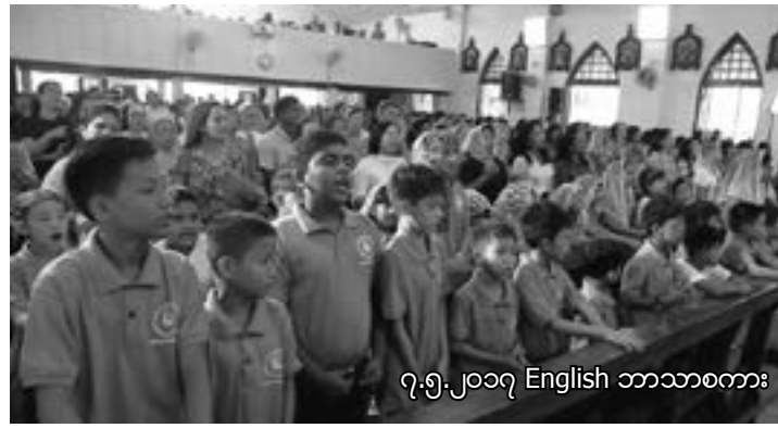
၇.၅.၂၀၁၇ English ဘာသာစကား

မစ္စား အစီအစဉ်များတွင် အထွေ ထွေ ဆုတောင်းခြင်းကို ဘာသာစကား အ မျိုးမျိုးဖြင့်ပြုလုပ်ခဲ့ပါသည်။ ထို့နောက် အစီ အစဉ်များတွင် ၇ ဘာသာစကားကို ကာ ဒီနယ်မှဦးဆောင်ပြီး ဆရာတော်များနှင့် အ တူ ခွဲခဲ့ပါသည်။ ပွဲတော် အစရက်က လွှင့် တင်ခဲ့သော အလံတော်ကို ဖာသာရ်ဒေါမိနစ် ခင်စိုးမှ ပြန်လည်ရုတ်သိမ်းခဲ့ပါသည်။