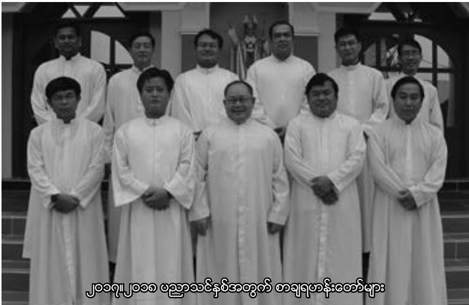
၂၀၁၇၊၂၀၁၈ ဖညာသင်နှစ်အတွက် စာချရဟန်းတော်များ