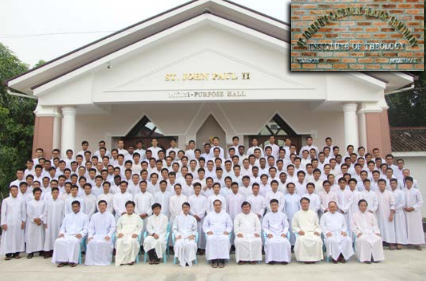
စာမျက်နှာ (၈)