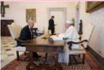
ပုပ်ရဟန်းမင်းကြီး ဖရန်စွသည် အ မေရိကန် ပြည်ထောင်စု သမ္မတ ဒေါနယ် ထရမ်းအား လက်ခံတွေ့ဆုံ စာမျက်နှာ ၅