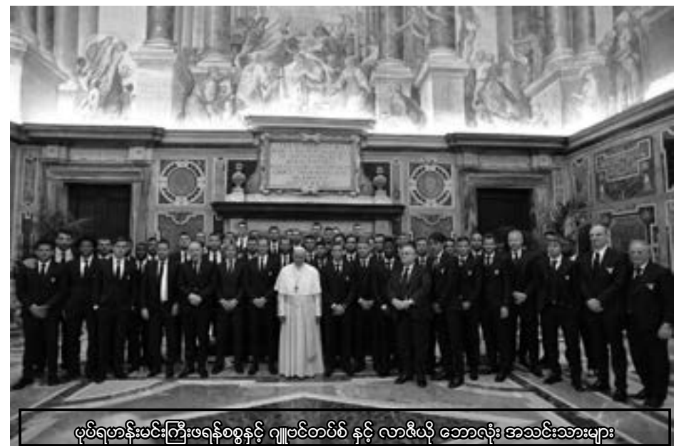
ပုပ်ရဟန်းမင်းကြီးဖရန်စစ်နှင့် ဂျူဗင်တပ်စ် နှင့် လာဇီယို ဘောလုံး အသင်းသားများ