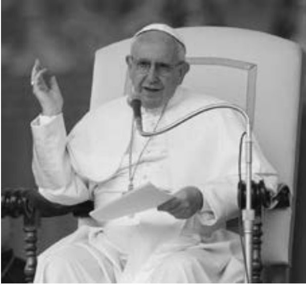
ချစ်လှစွာသောညီအစ်ကို၊မောင်နှမအပေါင်းတို့

ရှင်ပြန် ထမြောက်တော်မူသော ပါစကားပွဲတော်ကြီး၏ ဝတ်ပြုကိုးကွယ်ခြင်းအချိန်ကာလကို ကျင်းပနေသည့် ဖြစ်၍ ဗုဒ္ဓဟူးနေ့ လူထုပရိသတ်အား ခရစ်ယာန်မျှော်လင့်ခြင်း ဘုရားစကား အယူဝါဒဆိုင်ရာ သင်ကြားခြင်းကို ကော်ရိန်သု ပထမစာစောင်မှာ ရှင်ပေါလု ဖော်ကြားထားသည့် ကျွန်ုပ်တို့၏ မျှော်လင့်ရာသခင် ရှင်ပြန်တော်မူသောခရစ်တော် အကြောင်း ကို ကျွန်ုပ်ပြောကြားလိုပါသည်။