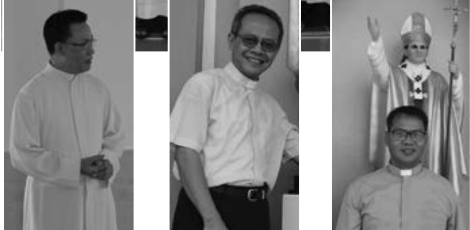
မြန်မာနိုင်ငံ ကက်သလစ်ဆရာတော်များ အဖွဲ့ချုပ် သတင်းဂျာနယ်