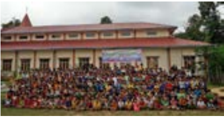
သာသနာပြု ကလေးငယ်များ သင်တန်း စာမျက်နှာ ၁၂