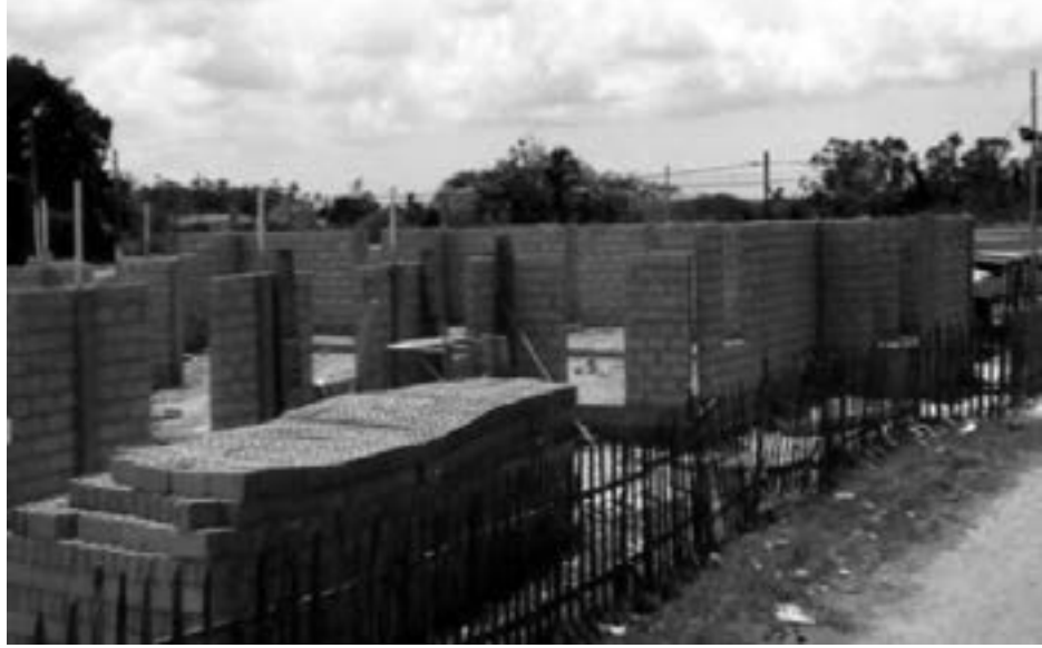
ဘာသာသူများ၏ ထည့်ဝင်ငွေ မမေရီကန် ဒေါ်လာ ၉၅၀၀၀ ဖြင့်ဆောက်လုပ်မည့် ဘုရားကျောင်းသည် စတုရန်းပေ ၈၀၀ ကျယ်ဝန်းပြီး လူပေါင်း ၂၀၀ ခန့် ဝင်ဆန့်နိုင်မည်ဟု မျှော်လင့်ထားသည်။ ထိုဘုရားကျောင်းအား ဂရုဏာရှင်ယေရှူးဘုရားကျောင်းဟု ခေါ်ဝေါ် သမုတ်မည်ဟုလည်း သိရသည်။