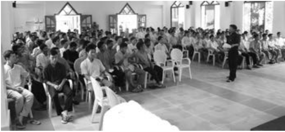
ရန်ကုန်၊ ၂၂ ရက် မေလ ၂၀၁၇

စိန်ကျီးဇက် မြန်မာနိုင်ငံလုံးဆိုင်ရာ ရဟန်းဖြစ်တက္ကသိုလ်(သီအော်လော်ဂျီဌာန) ရန်ကုန် ၏ ၂၀၁၇/၂၀၁၈ ဖညာသင်နှစ်ကို မေလ ၂၂ ရက် နေ့ နံနက် ၆း၃၀ နာရီတွင် တက္ကသိုလ် ဝန်းအတွင်းရှိ ဘုရားကျောင်း တွင် မစွားတရားတော်မြတ် ပူဇော်ခြင်းဖြင့် စတင်ခဲ့ပါသည်။