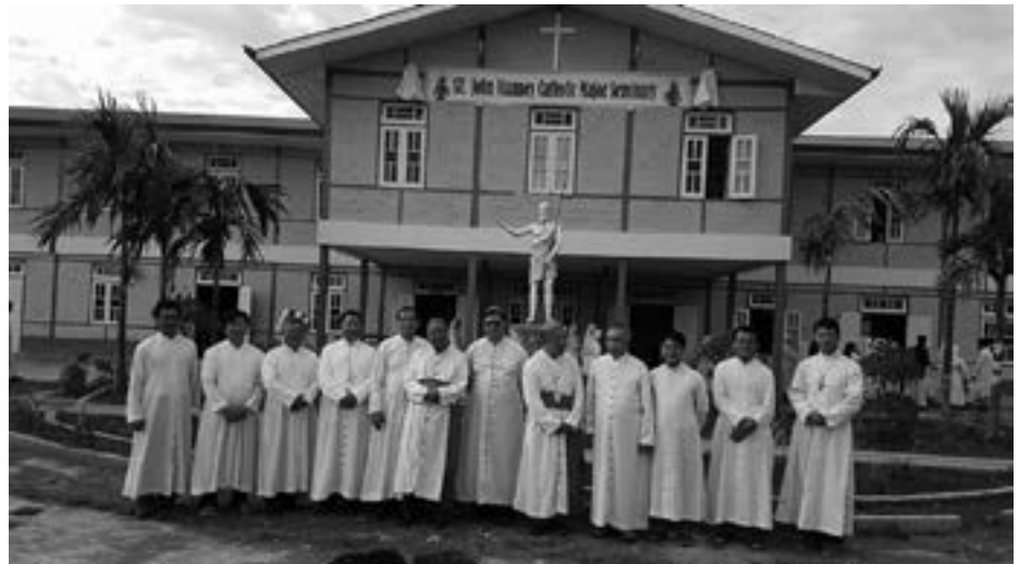
မြန်မာနိုင်ငံ ကက်သလစ်ဆရာတော်များ အဖွဲ့ချုပ် သတင်းဂျာနယ်