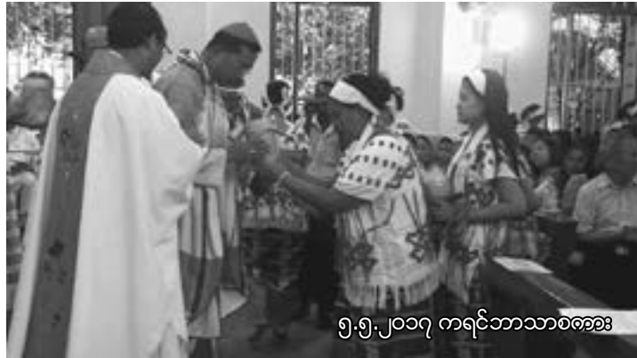
၅.၅.၂၀၁၇ ကရင်ဘာသာစကား

ထို့နောက်တွင် ရက်အလိုက် က ယန်းဘာသာ၊ သာ သနာပြု ကလေးငယ် များနှင့် မိသားစုကော်မရှင်များမှ အင်္ဂလိပ် ဘာသာ၊ ချင်းဘာသာ၊ တမိလ်ဘာသာ၊ တရုတ်ဘာသာနှင့် ဖာတီမာ သာသနာ အ မျိုးသမီးအဖွဲ့မှ လက်တင်ဘာသာ၊ ကချင် ဘာသာ တို့ဖြင့် မစ္စားတရား ပူဇော်ခဲ့ကြ သည်။ နေ့စဉ်နိဗ္ဗိဒ်များ မစ္စားတွင် မယ်တော် စိတန်းလှည့်လည်ခြင်း၊ ရိုးရာပဒေသာ အက များဖြင့် ဘုန်းတော်ကြီးများအား ပင့်ဆောင် ခြင်းများပြုလုပ်ခဲ့ပါသည်။